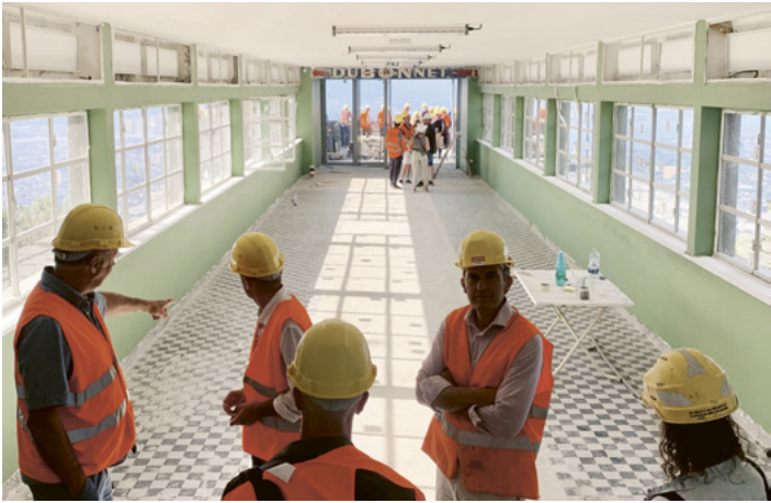
Photo : Visite du chantier du téléphérique du Salève par les architectes-conseil en juillet 2023

Renseignements sur le programme Mathias Apicella 04 50 88 21 10 conseils@caue74.fr